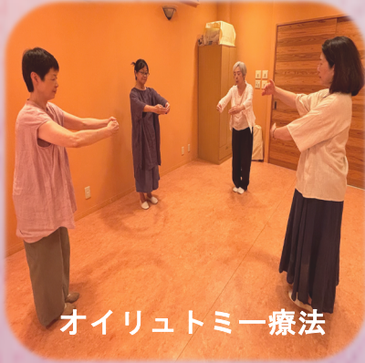
オイリュトミー療法